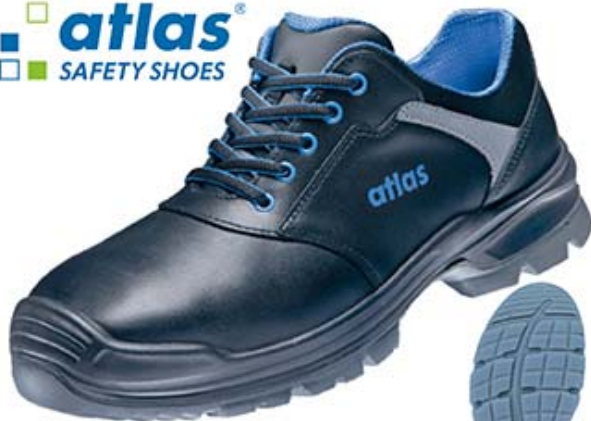
Anatomic Bau 560 XP S3 | Halbschuh