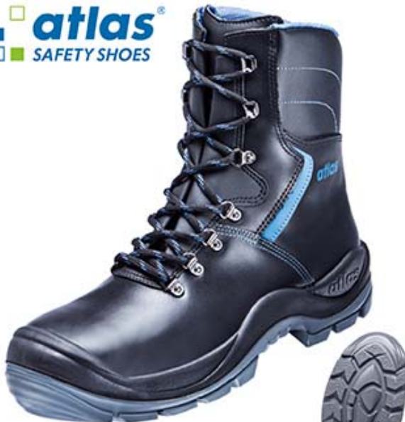
Anatomic Bau 845 XP CI S3 | Stiefel