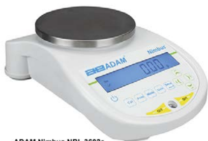
ADAM Nimbus NBL 3602e ADAM Nimbus NBL 3602i