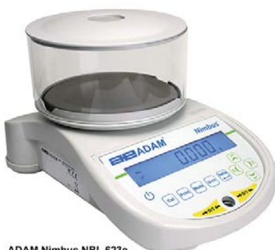
ADAM Nimbus NBL 623e ADAM Nimbus NBL 623i

Die für Wissenschaftler entworfene Nimbus Laborwaagenreihe besteht aus 15 Modellen, die die gesamte Bandbreite für Präzisionswaagen abdecken, von 0.1mg bis 0.1g. Durch innovatives Design haben sie eine kompakte Standfläche, und brauchen daher nur wenig Platz, behalten aber gleichzeitig höchste Leistungsfähigkeit. Der Waagenboden besteht aus einem einzigen Stück extrudiertem Aluminium, ein Material, das beste Temperaturregulierung bietet. Die Konstruktion aus einem Stück bedeutet höhere Stabilität, und damit eine sehr gute Wiederholbarkeit der Ergebnisse. Der Wägesensor der Nimbus ist auch aus einem einzigen Block gefertigt, und besteht aus weniger Teilen als eine traditionelle Analysenwaage. Dieser optimierte interne Mechanismus wird aus gehärtetem Material hergestellt, und somit ist die Nimbus dem anspruchsvollen ständigen Betrieb im Labor gewachsen. Kombiniert mit verbesserter Rechenleistung in der Elektronik sorgt der Hochleistungsmechanismus für eine hervorragende Leistung.