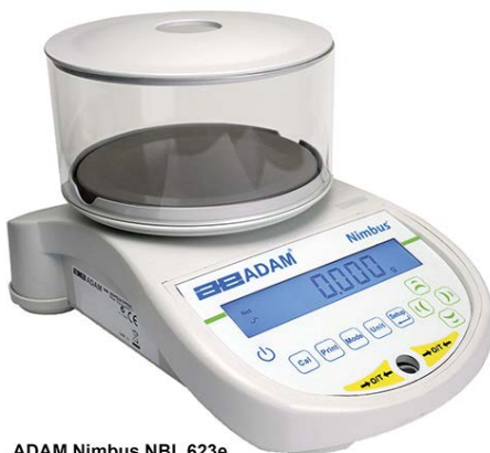
ADAM Nimbus NBL 623e ADAM Nimbus NBL 623i

Die für Wissenschaftler entworfene Nimbus Laborwaagenreihe besteht aus 15 Modellen, die die gesamte Bandbreite für Präzisionswaagen abdecken, von 0.1mg bis 0.1g. Durch innovatives Design haben sie eine kompakte Standfläche, und brauchen daher nur wenig Platz, behalten aber gleichzeitig höchste Leistungsfähigkeit. Der Waagenboden besteht aus einem einzigen Stück extrudiertem Aluminium, ein Material, das beste Temperaturregulierung bietet. Die Konstruktion aus einem Stück bedeutet höhere Stabilität, und damit eine sehr gute Wiederholbarkeit der Ergebnisse. Der Wägesensor der Nimbus ist auch aus einem einzigen Block gefertigt, und besteht aus weniger Teilen als eine traditionelle Analysenwaage. Dieser optimierte interne Mechanismus wird aus gehärtetem Material hergestellt, und somit ist die Nimbus dem anspruchsvollen ständigen Betrieb im Labor gewachsen. Kombiniert mit verbesserter Rechenleistung in der Elektronik sorgt der Hochleistungsmechanismus für eine hervorragende Leistung.