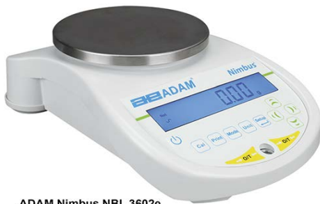
ADAM Nimbus NBL 3602e ADAM Nimbus NBL 3602i