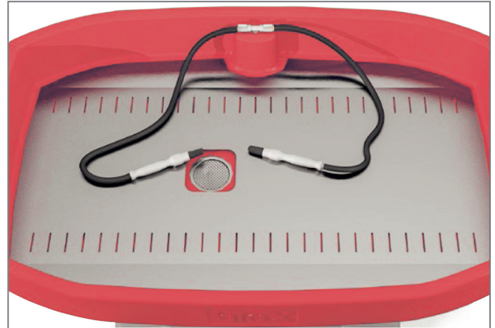
Lochblech zum Schutz der Arbeitsfläche. Dieser Edelstahlensatz deckt die komplette Arbeitsfläche ab.

Eine rechtlich verbindliche Zusicherung bestimmter Eigenschaften kann aus unseren Angaben nicht abgeleitet werden. Jede über die Produktgewährleistung bis zur Höhe des Produktwertes hinausgehende Haftung und Gewährleistung, sowie Schadenersatzansprüche sind ausgeschlossen. Irrtümer und Änderungen vorbehalten. Bei Erscheinen einer neueren Version verliert diese Version ihre Gültigkeit.