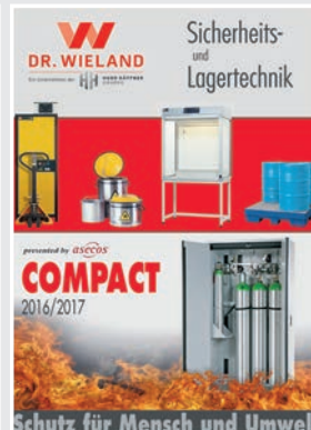
Sicherheits- und Lagertechnik