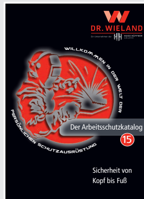
Arbeitsschutz / Persönliche Schutzausrüstung