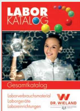
Laborgeräte und Laborverbrauchsmaterialien